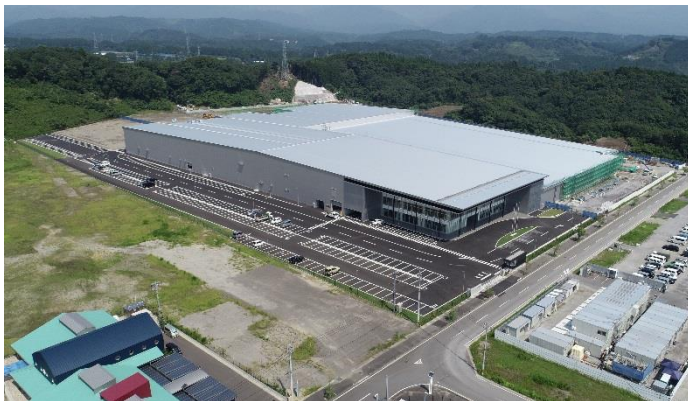
【宮崎日機装の外観】（鳥瞰）

所在地： 宮崎県宮崎市高岡町高浜 1495 番地 63 敷地面積： 約 122,000 m 2 総投資額（計画）： 170 億円 ※2021 年度末まで -航空宇宙工場+管理棟 112 億円 -インダストリアル事業他 45 億円 -土地 13 億円 従業員数： 170 名（2018 年 8 月末現在。内定者を含む。） ※2021 年度末までに、約 500 名を予定